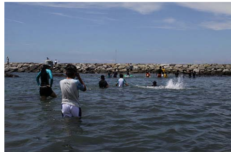
おもいっきり泳いだよ

試合が終わって、すぐに葉山の人たちともお別れになってしまいました。両チームともお礼、握手をしてさようならをしました。また冬に会えるのが楽しみです。