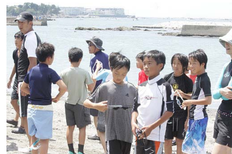
葉山のお友達とコーチ

冬は八王子に葉山のお友達がホームステイです。一日目は高尾山に日溜まりハイクです。子ども達はホームステイ、大人達は高尾の奥座敷で懇親会です。二日目は南八王子招待です。楽しく交流する2日間にして、思い出を一つ増やしてください。