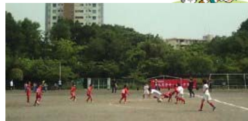
館町戦 前半 中盤での攻防

前半は、団子の中で1人が取られてもすぐに2人目、3人目のアプローチが早く相手のパスや突破を防ぎ、自分たちのボールで持っていた。ただ、後半は疲れからか、1人のみのアプローチで取り返せない事が多くなっていた。