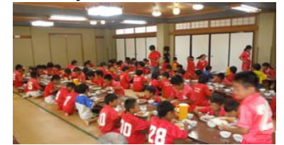
みんなよく食べたね!