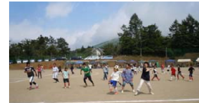
楽しかったね親子サッカー!