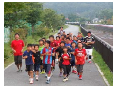
合宿 グランドと宿舎への行き帰りはランニング!!

6年生はまだまだ試合が沢山あります。残された7ヶ月、自分達が理想とするサッカーの創造をめざしてGAMB Aってください。“サッカーの三間”を思う存分楽しんでくださいね。 by 南のアンパンマン