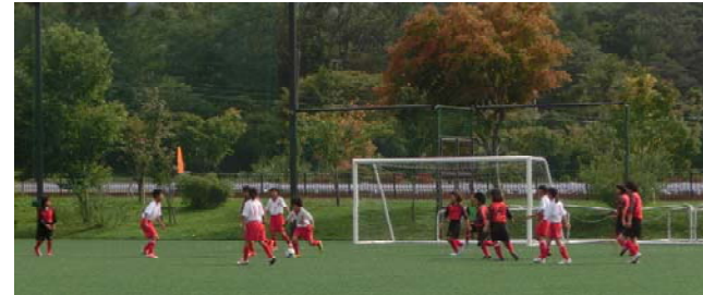
対山中湖レディース戦