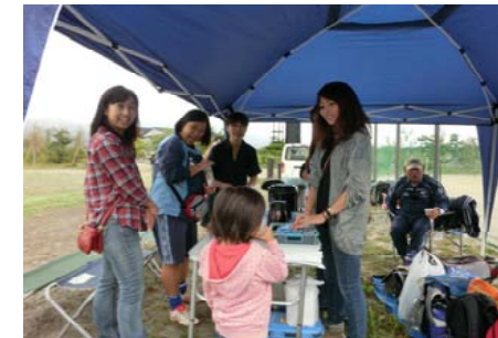
応援のお母さん方・妹たち