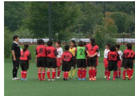
15-0で勝利、1位パートへ