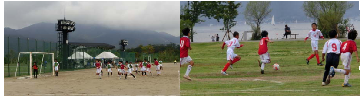
対モナークス戦 コーナーキックに...