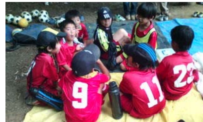
試合を振り返る2年生