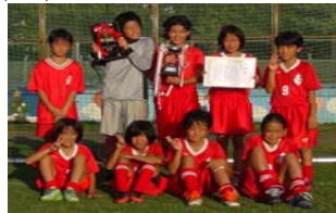
少女はやぶさ杯優勝！