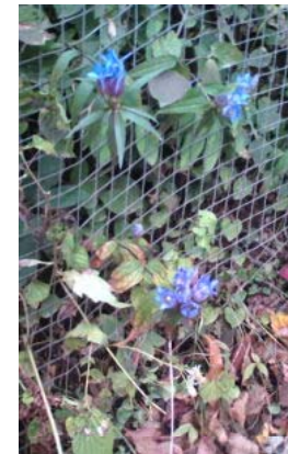
山頂付近にリンドウ

12月7日は天気にも恵まれて、葉山のお友達と陽だまりハイクを楽しんでほしいと願っています。 by南のアンパンマン