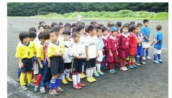
南招待に参加した仲間達